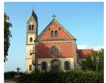
Kirche - Großenried

Mit der Lage im Neuen Fränkischen Seenland direkt am Altmühlradweg, unweit der mittelalterlichen Städte Rothenburg o.d. Tauber, Feuchtwangen und Dinkelsbühl sowie der Rokoko-Stadt Ansbach, haben wir als Gäste vielfältige Möglichkeiten.